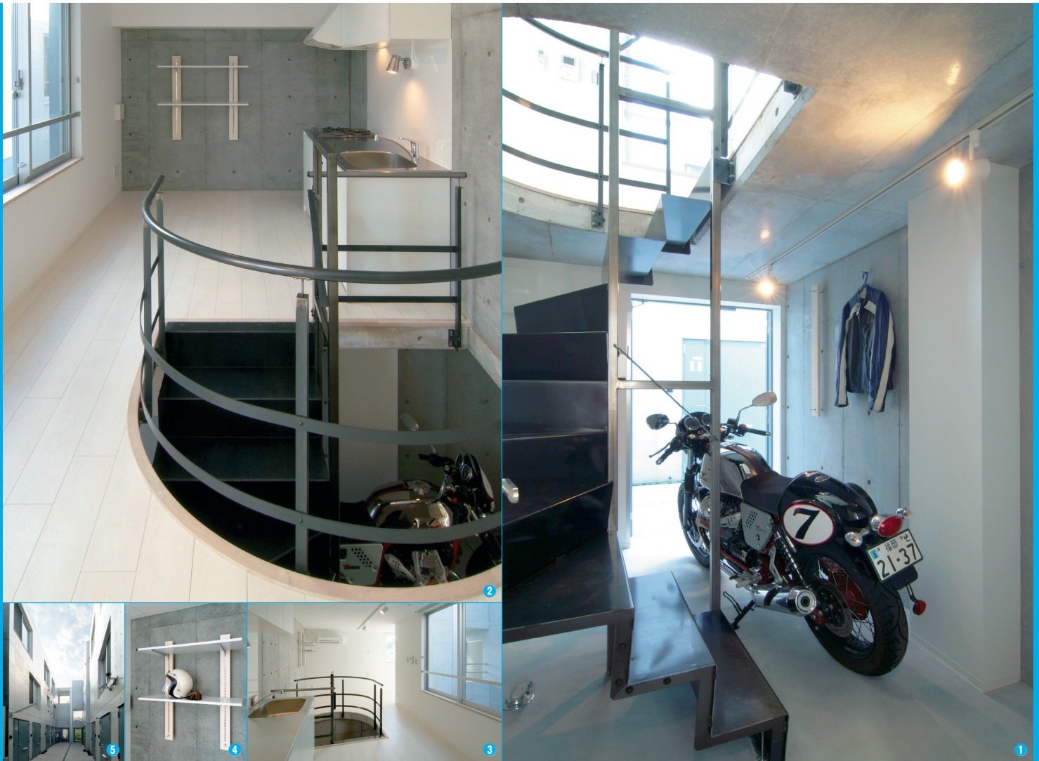
①土間の奥から入口を見たところ。コンクリート打ち放しの壁と床がクールな雰囲気。1階には、バス&トイレと洗濯機置き場が備わる。 ②開口部の大きな螺旋階段のおかげで上階からも愛車を眺めることができる。使い勝手の良さそうなキッチンは1~2人暮らしには十分なサイズ。③大きな窓と白い壁で室内は明るい。対面する部屋の窓は少しずらしてあり、プライバシーも守られる。④コンクリートを流し込み際のセパ穴を利用して、収納棚が設置される。市販のボルトやフックで棚を増やすことも可能。⑤横丁にある長屋を意識してデザインされた外観。